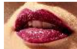
33847 Красный Виноград