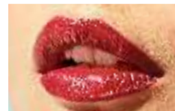
33845 Огненная Лава