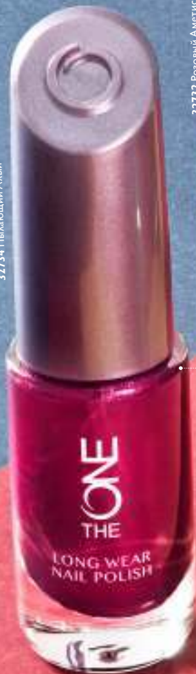
32732 Розовый Аметист