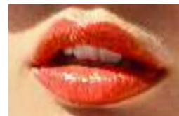
33844 Свежий Грейпфрут