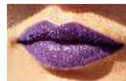
33848 Спелый Инжир